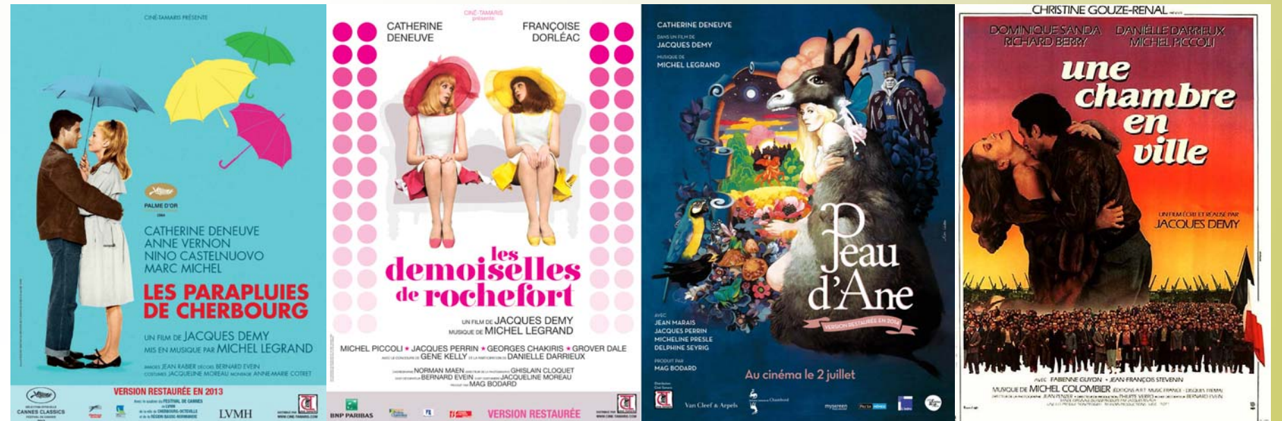
Principaux films réalisés par Jacques Demy

«Ce sont des souvenirs d'enfance, de vacances, de campagne, des images du Val de Loire...» Jacques Demy